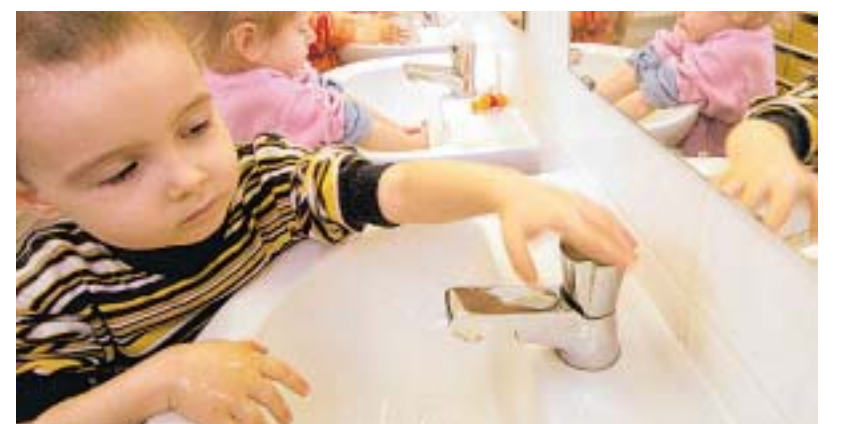
Beim Waschen werden die Hände schön sauber, das Wasser aber verunreinigt. In einer Kläranlage wird es wieder gereinigt.